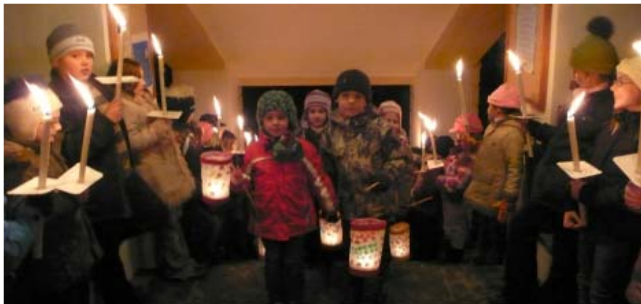
Laternenfest in Donnersbach

An einen Haushalt Postgebühr bar bezahlt