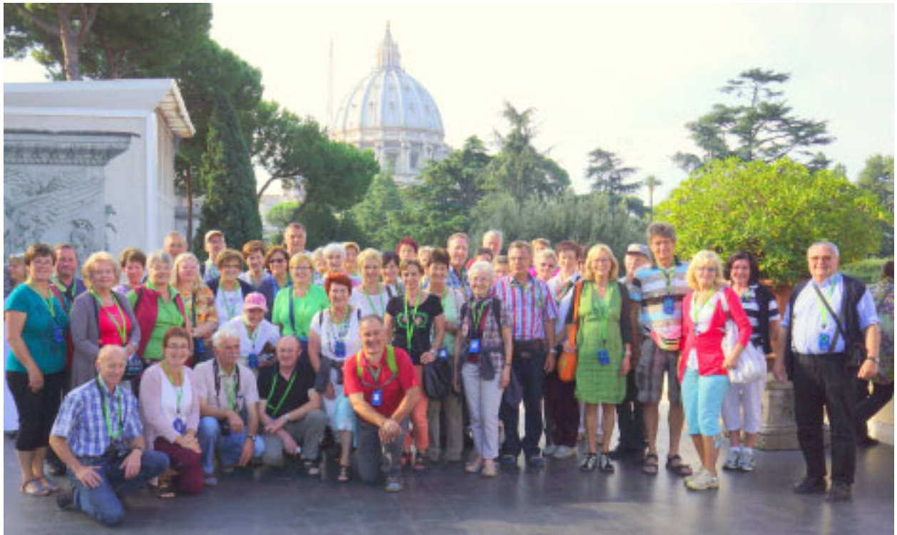
Romreise des Pfarrverbandes

An einen Haushalt Postgebühr bar bezahlt