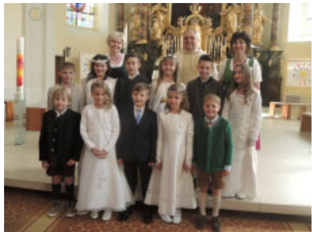
Volksschule Irnding, Klasse 2b