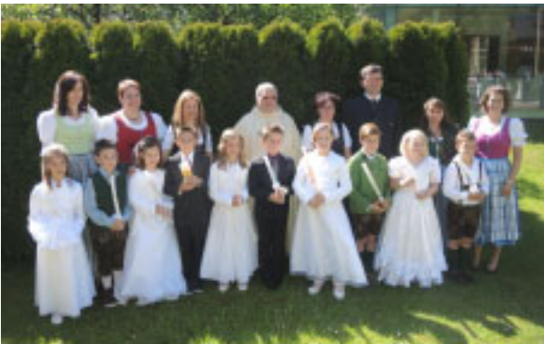
Volksschule Aigen, Klasse 2a

Die Feiern wurden von vielen Schülern, Lehrern und Eltern vorbereitet. Herzlichen Dank an alle, die zum Gelingen dieser Feiern mitgewirkt haben.