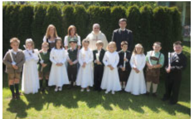
Volksschule Aigen, Klasse 2b