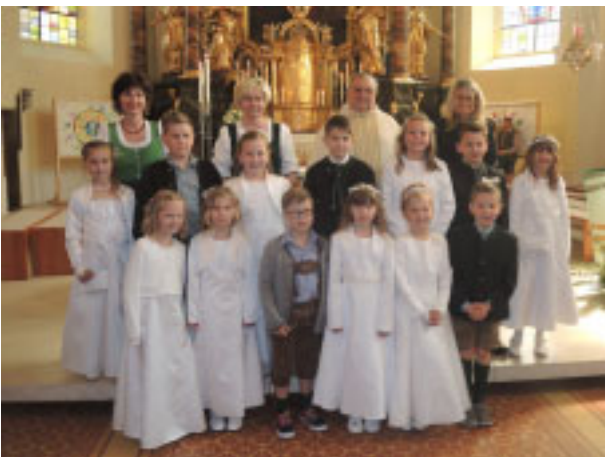
Volksschule Irnding, Klasse 2a