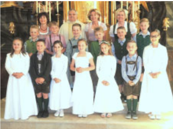
Volksschule Irnding, Klasse 2a