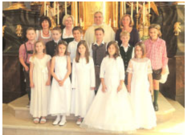
Volksschule Irnding, Klasse 2b