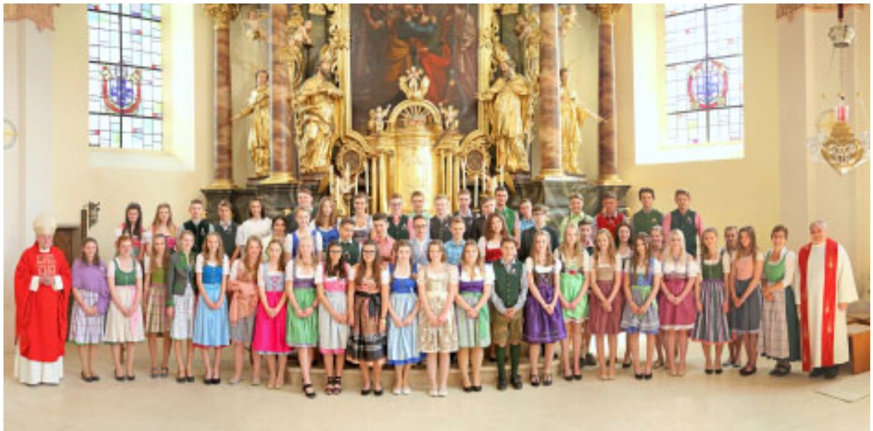
Firmung in Irndning

An einen Haushalt Postgebühr bar bezahlt