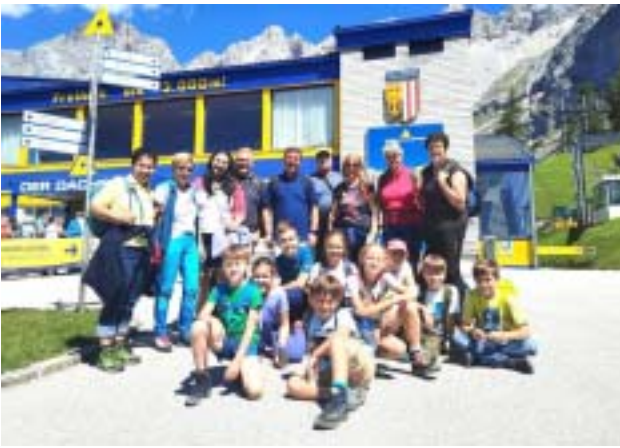
Donnersbacher Ministranten am Dachstein