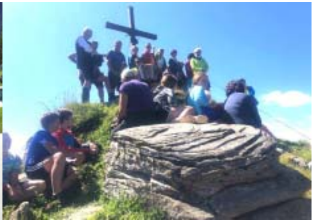
Bergmesse am Schabspitz