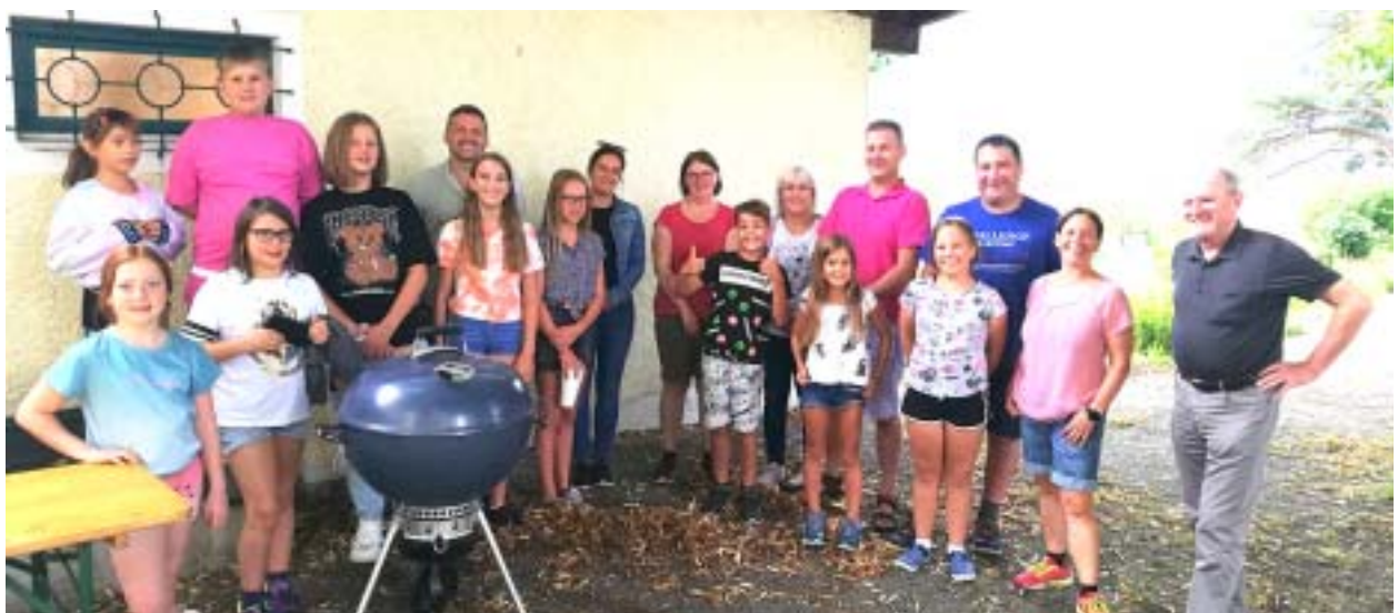
Grillfest der Aigener und Irndinger Minis