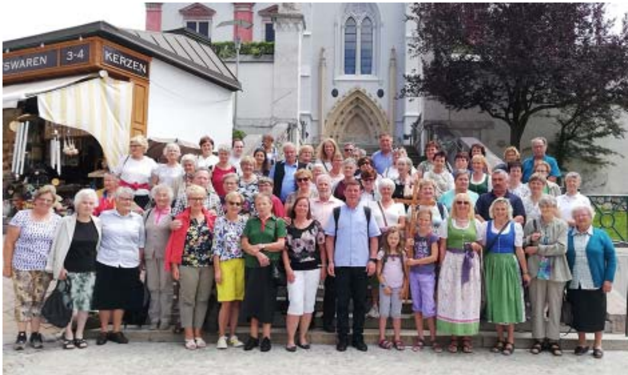
Wallfahrt nach Mariazell

An einen Haushalt Postgebühr bar bezahlt