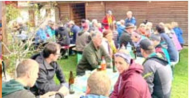
Familienwandertag der Pfarre Donnersbach