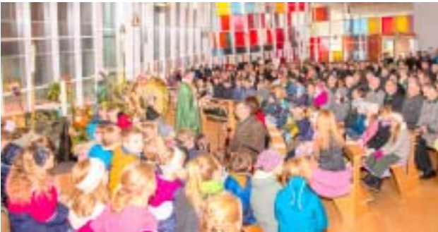
Erntedank Florianikirche Aigen