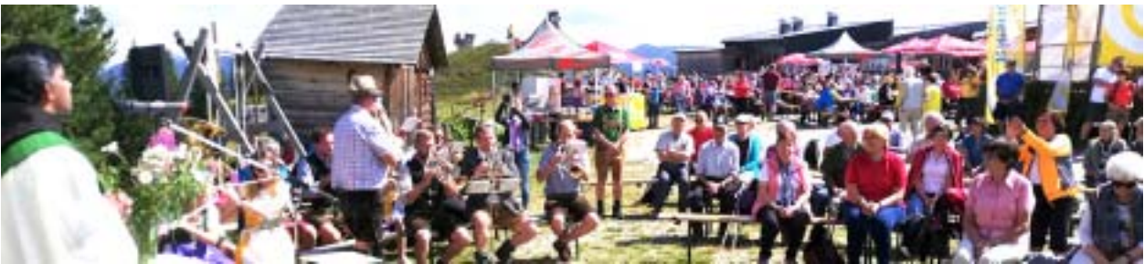
Bergmesse am Hochsitz